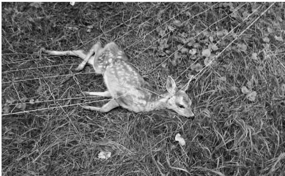
Rehkitz, das sich in einem elektrifizierten Weidenetz verheddert hat.

Der gewissenhafte Unterhalt sowie das entfernen von nicht mehr benötigten Zäunen ist daher überlebenswichtig für die Wildtiere.