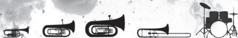
CORNET · FLÜGELHORN · ES-HORN · EUPHONIUM · BARITON · TUBA · POSAUNE · SCHLAGZEUG · PERCUSSION

WIR STELLEN DIR MUSIKINSTRUMENTE VOR, DIE DU IN ZIHLSCHLACHT ERLERNEN KANNST.