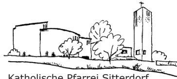
Katholische Pfarrei Sitterdorf

Liebe Pfarreiangehörige, liebe Leserinnen und Leser