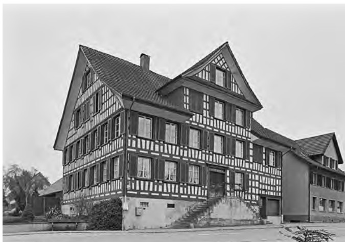
Schutzobjekte der Gemeinde Zihlschlacht-Sitterdorf Hauptstrasse 45, 8588 Zihlschlacht