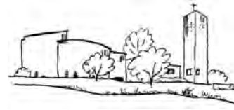
Katholische Pfarrei Sitterdorf

Weitere Informationen: www.evangsitterdorf.ch