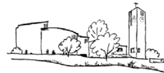
Katholische Pfarrei Sitterdorf

Weitere Informationen: www.evansitterdorf.ch