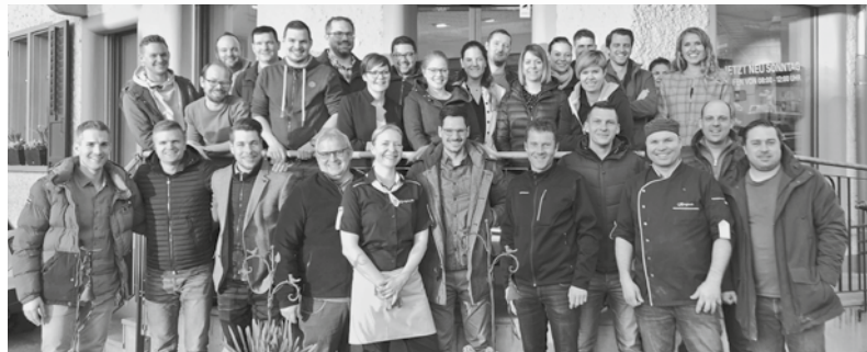
Junior Chamber International Oberthurgau / Worldwide Federation of Young Leaders and Entrepreneurs

Vorstand Junge Wirtschaftskammer Oberthurgau