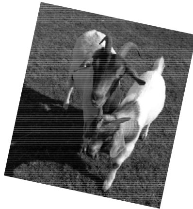
Flecki & Goldy