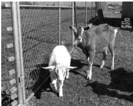
Schmusi & Brunny