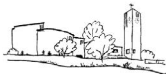
Katholische Pfarrei Sitterdorf

Zur Osternachtfeier laden wir Sie am Samstag, 31. März um 20.30 Uhr ein. Zur Segnung des Osterfeuers treffen wir uns vor der Kirche und ziehen anschliessend mit dem Osterlicht in die dunkle Kirche ein.