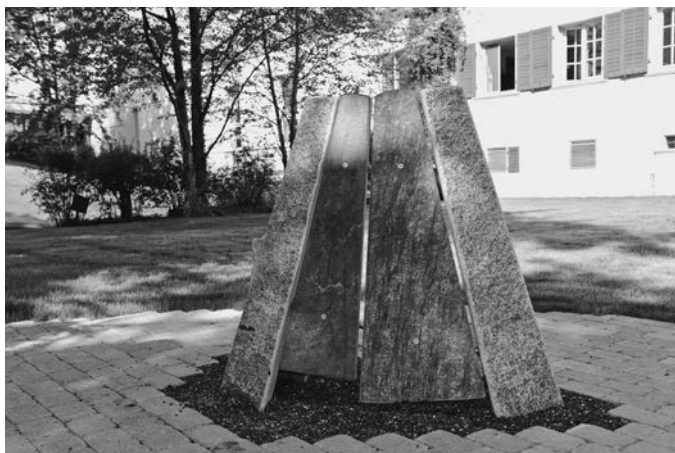
Klangpark Pro Humanis Quintensteine