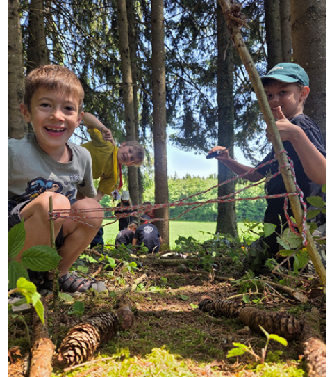
Gemeinsam bauten die Wölfe eine Kugelbahn zum Transport der Gänseeier.

Wenn auch du dabei sein willst, findest du weitere Informationen auf unserer Website. https://bischofberg.ch/