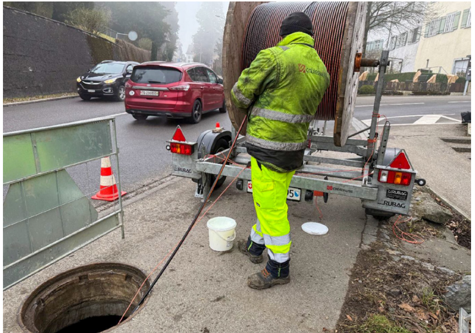
In Zusammenarbeit mit der Q-Line forcieren die TGB den Glasfaserausbau in Bischofszell.

Im Reporting von Verwaltungsrat und Geschäftsleitung wurden kürzlich der Betriebskommission weitere strategische Themen vorgestellt. Dazu gehören der FTTH-Glasfaserausbau, die Evaluation von Batteriespeichern sowie neue Dienstleistungen für Energieverbrauchsgemeinschaften (EVG/LEG). Ein weiteres Thema war der Stromunterbruch vom 7. Januar 2026. Die TGB infor-