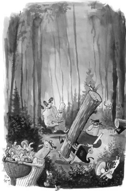
Wir sammeln und pflücken mit Mass. Dieser Cartoon von Max Spring stammt aus dem Wald-Knigge der Arbeitsgemeinschaft für den Wald: www.waldknigge.ch .